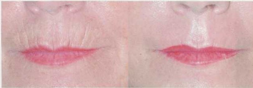
Vorher und 4 Wochen nach der Dermabrasion: Sehr tiefe Falten können nicht vollständig eingeebnet werden. Eine weitere Behandlung ist nach 3 bis 6 Monaten sinnvoll

darauf eindrücklich hingewiesen werden und sich entsprechend vorbereiten und darauf einstellen.