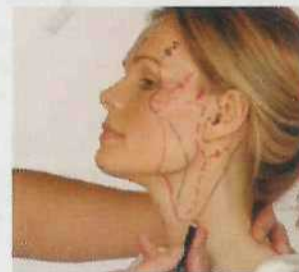
BEI DER VORBEREITUNG FÜR EIN FACELIFT WERDEN DIE ZUKÜNFTIGEN PROPORTIONEN GENAU VERMESSEN